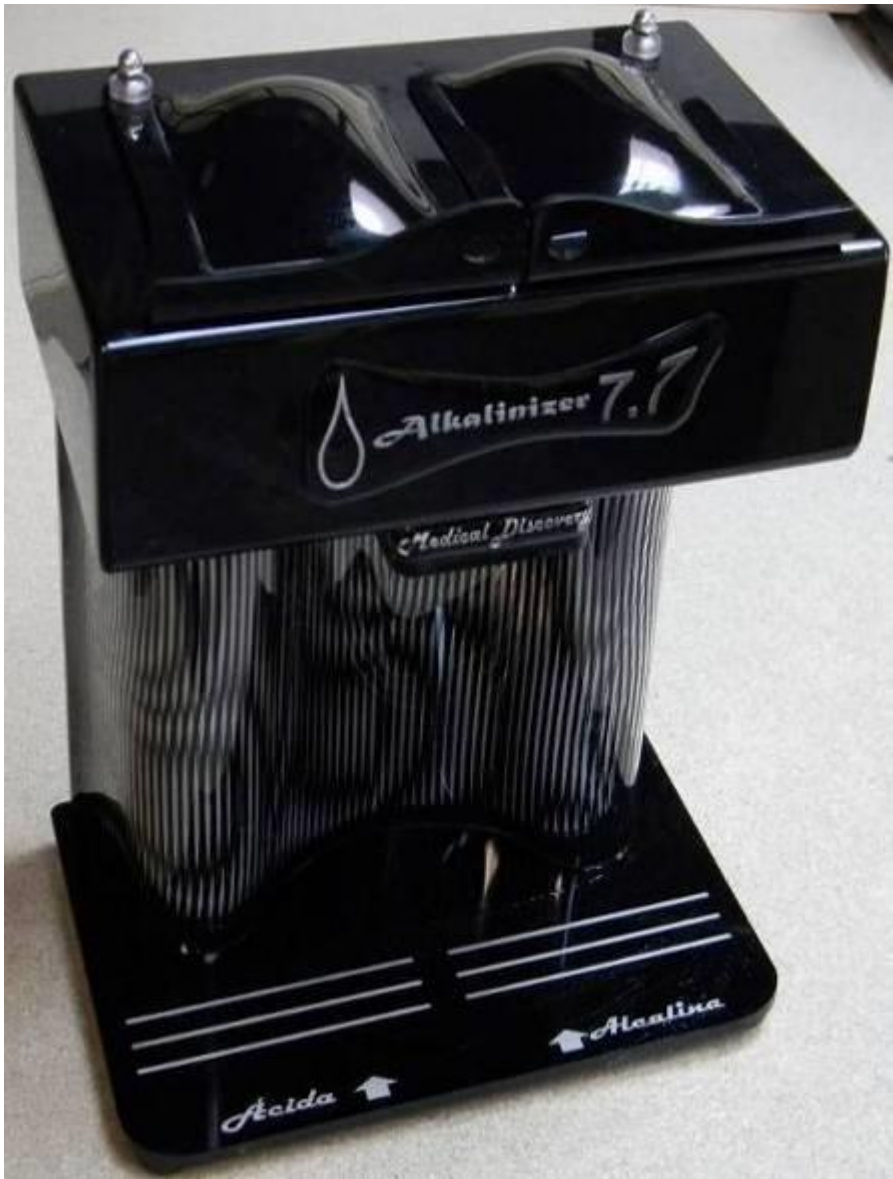
Sintetizador 7.9 modelo internacional 2013